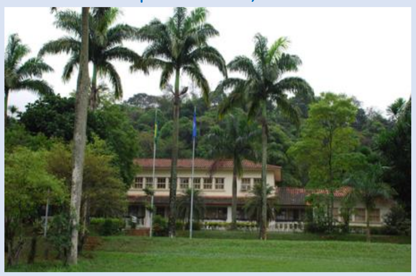
PANAFTOSA was my workplace while I worked with PAHO